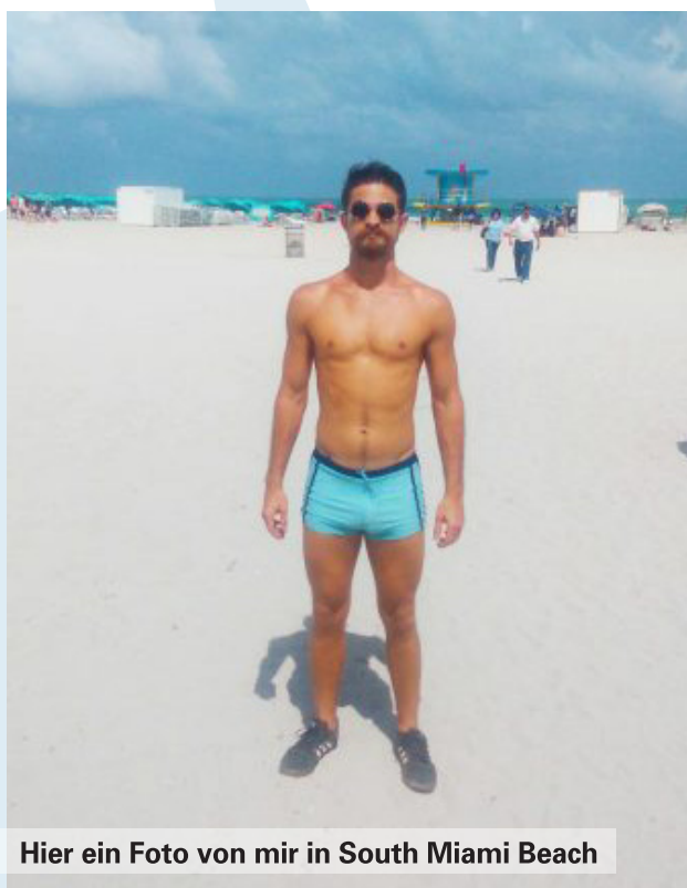
Hier ein Foto von mir in South Miami Beach

Nun, in South Miami Beach ist dies tatsächlich eine durchaus akzeptable Bekleidung. Es gibt eine Menge Europäer hier die oft sehr knappe Badehosen tragen, aber gemäß den amerikanischen Standards ist dies eine sehr dürrtige Badehose. Ich finde dass die meisten Amerikaner außerhalb von Miami Beach tatsächlich denken, dass ich absichtlich versuche mich lächerlich und komisch zu machen wenn